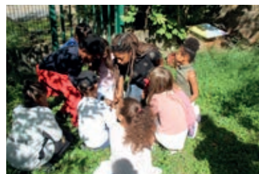
Découverte de la Nature en ville au Grain d'Org'

L'objectif est ainsi de sensibiliser petits et grands à la protection de la Nature et que chacun devienne acteur de la qualité de son cadre de vie.