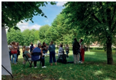
Temps d'échanges avec les habitants

Avec les équipes d'architectes (Stavy architectes), de paysagistes (C3I) et d'ingénieurs (TPFI) retenues pour ce marché de maîtrise d'œuvre, l'objectif était de permettre à chacun d'exprimer ses attentes au regard de l'opération de renouvellement urbain, aussi bien sur leurs logements, que sur les parties communes ou les espaces extérieurs.